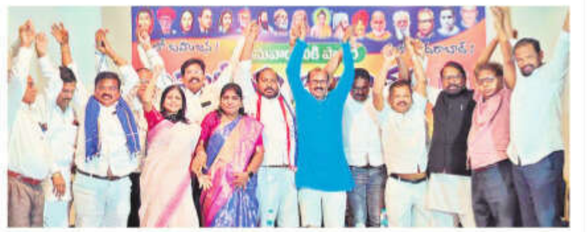
సమావేశంలో పాల్గొన్న సంఘాల నాయకులు