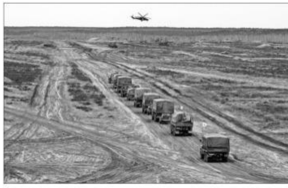
Tanks move during the Russia-Belarus military drills at a training ground in Belarus

Western leaders warned that Russia was poised to attack its neighbour, which is surrounded on three sides by about 150,000 Russian soldiers, warplanes and equipment. Russia held nuclear drills on Saturday as well as the conventional exercises in Belarus, and has ongoing naval drills off the coast in the Black Sea.