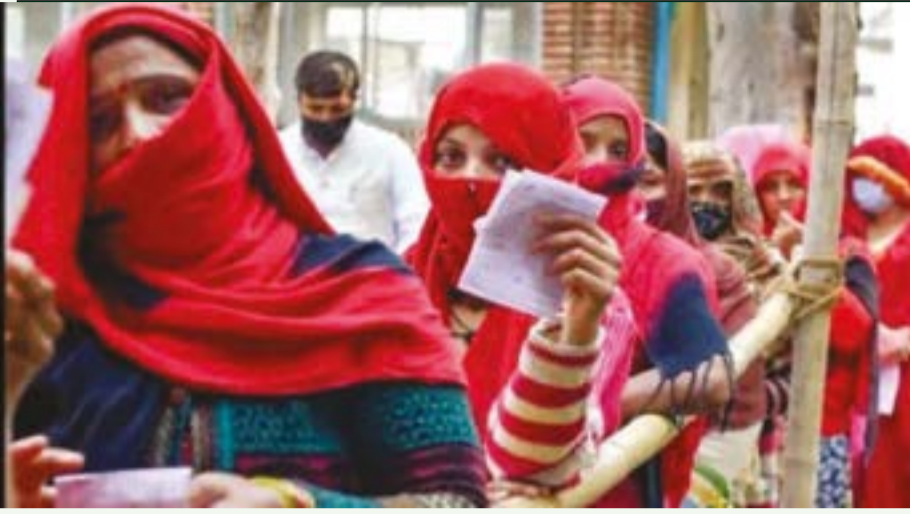
7 கட்டங்களாக தேர்தல் அறிவிக்கப்பட்ட உத்தரபிரதேசத்தில் கடந்த 10ம் தேதி முதல் கட்ட தேர்தலும், 14ம் தேதி 2ம் கட்ட தேர்தலும் நடந்தது. மணிப்பூரில் வரும் 27ம் தேதி, அடுத்த மாதம் 5-ம் தேதியில் என

சண்டிகர், பிப்.21: பஞ்சாப் மாநிலத்தில் உள்ள 117 தொகுதிகளுக்கும் ஒரே கட்டமாக நேற்று தேர்தல் நடைபெற்றது. இதே போல் உத்தரபிரதேசத்தில் 59 தொகுதிகளுக்கு 3ம் கட்டமாகவும் நேற்று சட்டசபை தேர்தல் வாக்குப்பதிவு விறுவிறுப்பாக நடந்தது. இதற்காக வாக்காளர்கள் காலை முதலே நீண்ட வரிசையில் நின்று தங்களது ஜனநாயக கடமையாற்றினர். பஞ்சாப், உத்தரபிரதேசம், உத்தரகாண்ட், கோவா, மணிப்பூர் மாநில சட்டமன்ற பதவி காலம் முடிவடைந்ததை அடுத்து இந்திய தலைமை தேர்தல் ஆணையம் தேர்தல் அறிவித்ததைடுத்து உத்தரகாண்ட், கோவாவில் ஒரே கட்டமாக நடந்த 14ம் தேதி தேர்தல் நடத்தி முடிக்கப்பட்டது.